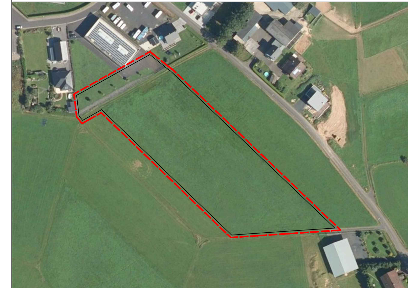
Luftbild (ohne Maßstab)