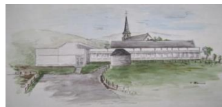
Grundschule in der Au