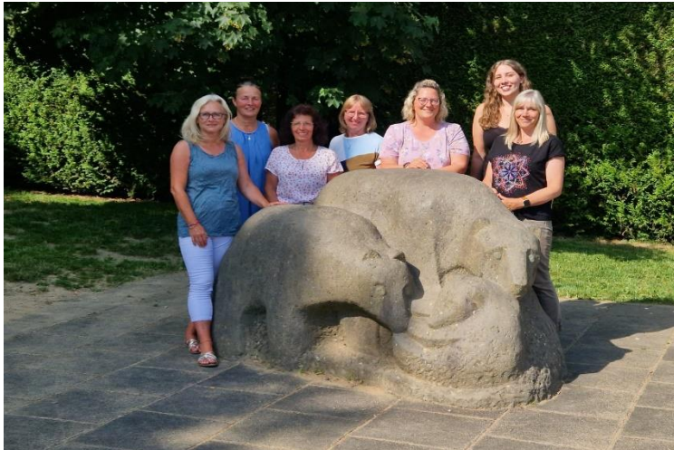
Team BGS Asbach