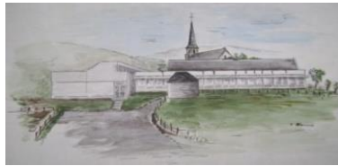
Grundschule in der Au